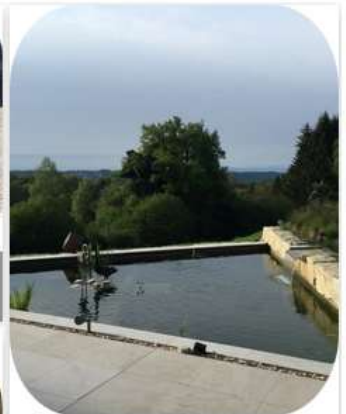
Wasser im Garten