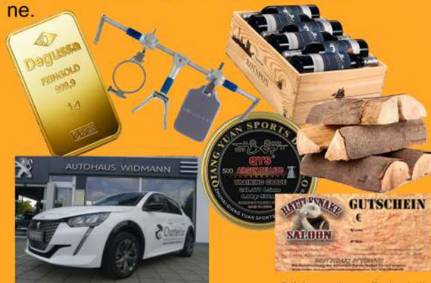
Bilder zeigen Beispielbilder

Teilnehmer auf den Plätzen 2 - 20 erhalten Goldpreise, hochwertige Sachpreise sowie Gutscheine.